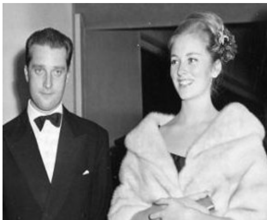
Albert en Paola in 1959